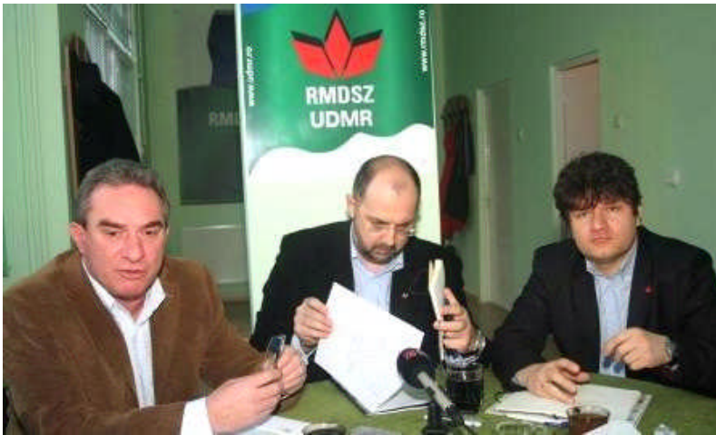
Sajtótájékoztatón Déván Kelemen Hunor RMDSZ szövetségi elnökkel és Széll Lőrincz ifjúsági államtitkárra

A kongresszusi dokumentumból kiindulva, az RMDSZ szövetségi elnöke áprilisban munkacsoportot hozott létre, amely cselekvési tervet készít az európai uniós kisebbségi keretszabályozás elfogadtatására. A dokumentum értelmében a munkacsoport konzultációt kezd a Kárpát-medencei magyar érdekképviselői szervezetekkel és pártokkal, valamint az Európai Unióban élő őshonos nemzeti kisebbségek szervezeteivel, megvizsgálja, hogyan hasznosítható az állampolgári kezdeményezés nevű új európai eszköz a keretszabályozás elfogadtatása szempontjából. Kelemen Hunor szövetségi elnök előterjesztésében kiemelte, hogy meg kell teremteni az európai őshonos nemzeti közösségek jogait tartalmazó keretszabályozást, amelynek része kell legyen a közösségek önrendelkezése, az autonómiaformák, az anyanyelv-használati, oktatási és kulturális jogok.