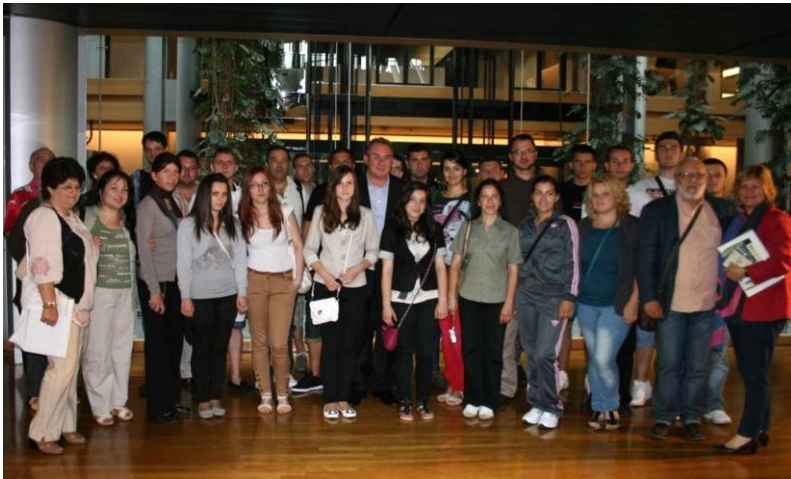
Látogatócsoport Strasburgban 2011 júniusában

A húszfős csapat meglátogatta az Európai Parlament épületét, megismerkedett az intézmény működésével. Az intézményt bemutató előadáson az európai szellemiségről beszéltem: Az EU a politikai elit építménye, azonban menetközben egyértelmű lett, hogy csak az európai népek akarata révén lehet európai jövőt építeni. Az Európai Parlament, amelynek tagjait direkt választják meg, 1979 óta az unió alapintézménye. Itt a parlamentben az európai állampolgároknak nemcsak a választottjaikon keresztül kell hangjukat hallatniuk, hanem közvetlenül is. Tavaly több mint 5000 romániai állampolgár látogatta meg az Európai Parlamentet, egy része az én meghívásomra. A mai esemény ismét egy lehetőséget ad arra, hogy a hazai művészek számára európai tapasztalatot szerezzünk. Meggyőződésem, hogy a művészek az úttörő gondolkodásmód követői, éppen ezért arra kérem önöket, hogy hazatérve, népszerűsítsék az európai szellemiséget.