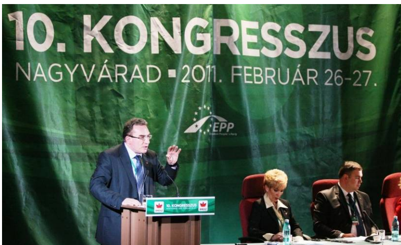
Az RMDSZ 10. Kongresszusának szónoki emelvényén

Az RMDSZ februári, nagyváradai X. kongresszusát az elmúlt egy év legfontosabb politikai eseményének tartom, még akkor is, ha az nem közvetlenül kapcsolódik az Európai Parlamentben (EP) végzett munkámhoz. Az új RMDSZ elnök megválasztását megelőző időszak a kívülálló számára is izgalmas és érdekes folyamatot jelentett, még akkor is, hogyha Kelemen Hunor győzelme igazából nem volt kétséges. Fél év távlatából ugyanúgy jellemezném ezt az időszakot, mint ahogyan akkor fogalmaztam, amikor megyei szervezet elnökeként elsők között támogattam Kelemen Hunor jelölését: természetes folytonosság és a szükségszerű változások. A Hunyad Megyei Küldöttek Tanácsában a következő gondolatokkal ajánlottam Kelemen Hunor jelölésének támogatását: 1996-ban szinte egyszerre kezdtem politikai tevékenységemet Kelemen Hunorral. Sokat dolgoztunk és terveztünk együtt, és személyes tapasztalatból állítom, hogy Kelemen Hunor az a jelölt, aki elnökként megőrzi Szövetségünk önállóságát és ezzel egyidejűleg a Romániai Magyar Demokrata Szövetség belső egyensúlyát. A romániai magyarságnak európai, jól kommunikáló, kiegyensúlyozott és eredményorientált képviselőre van szüksége. Ez az a szervezet, amelyet együtt építettek az alapítók és a mi generációnk, és ezt a szervezetet kell megerősíteni közösségünk szolgálatában.