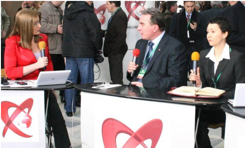
Televíziós-beszélgetés az RMDSZ Kongresszuson

az identitás megőrzéséhez kapcsolódó területeken: oktatás, kultúra, hagyományok, média és helyi gazdaság. A kulturális és területi autonómiaformák közjogi keretben, a közösség által közvetlenül választott testületek és az ezek számára törvényesen biztosított hatáskörök révén valósíthatók meg. Az RMDSZ célja, hogy az Európai Néppárttal (EPP) és más európai szövetségesekkel közösen lehetőséget teremtsen egy európai szintű kisebbségi keretszabályozás elfogadtatására. Az autonómiaformák létének elfogadását, illetve politikai és jogi megteremtését – az Európai Unió (EU) által is hivatalosan jóváhagyott és a tagállamok irányában szorgalmazott – önkormányzatiság és szubszidiaritás elvei alapján tartjuk lehetségesnek és igazoltnak – áll az RMDSZ dokumentumában. A következő évekre ezek a gondolatok adják majd a keretét a Szövetség külpolitikai cselekvésének keretét, ugyanakkor pedig a Brüsszelben dolgozó európai parlamenti képviselők mandátumát.