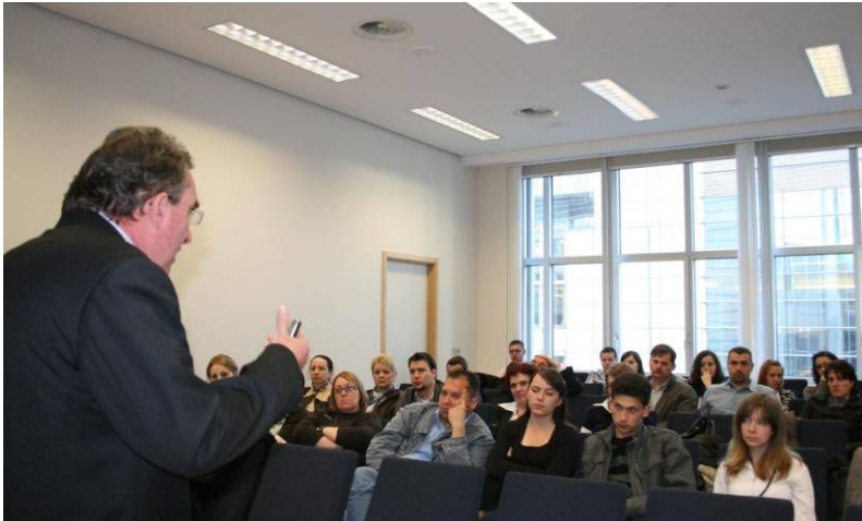
A romániai magyar közéletéről beszéltem fiataloknak az Európai Parlamentben

magyarság képviselői már nem ülnek a román törvényhozásban. Egy ilyen forgatókönyvnek beláthatatlan következményei volnának az erdélyi magyarság számára.