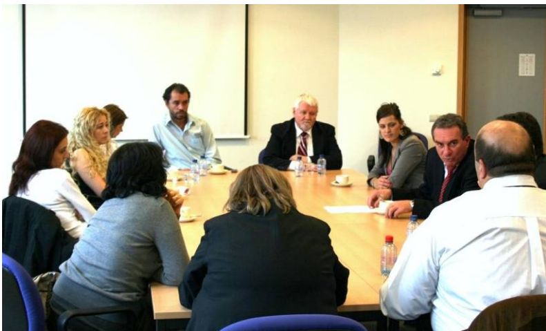
Sajtóbeszélgetés romániai újságírókkal Brüsszelben

Az EPP programalkotó bizottság ülésén annak szükségességéről beszéltem, hogy a dokumentumban foglalkozzon külön rész az őshonos nemzeti kisebbségek jogainak védelméről, megkülönböztetve a nemzeti kisebbségek jogait a bevándorló, új európai kisebbségek által jelentett problémakörtől. A kisebbségi jogokkal kapcsolatban az RMDSZ saját módosító javaslatokat nyújtott be, amelyek a kisebbségek védelméről, az európai kisebbségi keretszabályozás megteremtésének szükségességéről, az anyanyelvű oktatás és az anyanyelvhasználat biztosításáról, az európai pozitív gyakorlatok hasznosíthatóságáról szólnak. Ezeket a jogokat rögzítette az EPP egy korábbi dokumentuma, amelyet szintén az RMDSZ javaslatára fogadott el az európai alakulat 2009-es bonni kongresszusa.