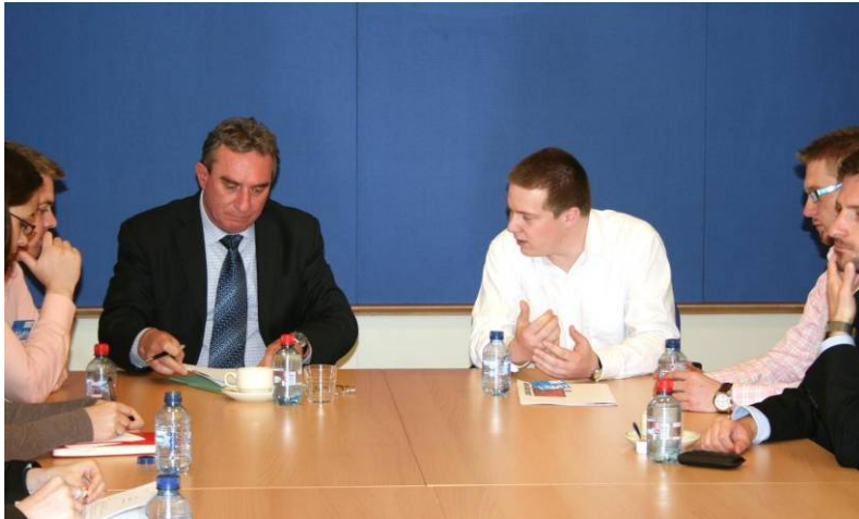
Találkozó a MIÉRT küldöttségével Brüsszelben

próbája egyébként az Európa 2020 stratégia települési összetevőjének kidolgozása volt, éppen abban az időszakban, amikor az EU intézményei épp a stratégiát készítették elő. A verseny célja a projekt-alapú gondolkodásmód népszerűsítése volt a romániai magyar fiatalok körében, tudásuk mélyítése az európai projekt-menedzsment terén, illetve olyan kreatív, életképes, kidolgozott ötletek generálása, amelyek majd az EU által támogatott projektek listájára kerülhetnek.