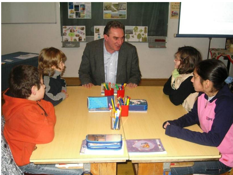
Rendhagyó Európa-óra dévai kisiskolásoknak

oszlopait összetartó szegecsek, tehát már több mint száz évvel azelőtt, hogy az EU megalakult volna, Erdély már része volt az európai gazdasági rendszernek. A mostani kisdíákoknak új életlehetőségeik vannak, az EU bármely országában továbbtanulhatnak, ha jól elsajátítanak egy szakmát, bármelyik európai országban kamatoztathatják tehetségüket. Arra biztattam a gyerekeket, hogy tekintsék előnynek és értéknek azt, hogy tízévesként már két nyelvet ismernek, beszélnek magyarul és románul, az iskolában pedig már tanulják a harmadik nyelvet.