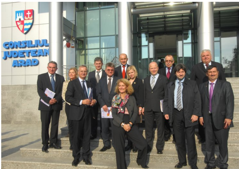
A regionális fejlesztési bizottság látogatása Aradon 2010 novemberében

Elképedéssel figyeltem júniusban, az ország közigazgatási átszabása kapcsán, gyakran nemzeti hisztériába fulladt romániai vitát. Egyértelműen kihallatszott, hogy mekkora különbség van sok román politikusnak az európai folyamatokról alkotott véleménye és a romániai hétköznapi valóság és szükségletek között. Az elmúlt egy évben sok ülésen, vitán és találkozón kifejtettem azon véleményemet, hogy Romániának át kell szerveznie a fejlesztési régiókat az EU pénzalapok hatékonyabb lehívása és felhasználása érdekében.