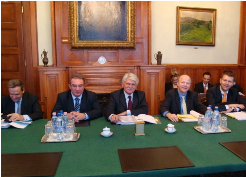
Budapesten a nemzetközi kereskedelmi bizottság küldöttsége

A jelentésben kitértem arra, hogy az Európai Bizottságnak a hatékonyság, az átláthatóság és a felelős felhasználás figyelembe vételével kötelező módon tájékoztatnia kell az Európai Parlamentet a segély felhasználásának módjáról. Jelentéstevőként elégedettségemet fejeztem ki, hogy a határozatot döntő többséggel fogadták el az európai képviselők, ami fontos jelzés a kisinyovi kormány felé, arra bátorítja, hogy folytassa munkáját a demokratikus berendezkedés és az európai orientációjú politizálás folytatása érdekében. Reményemet fejeztem ki, hogy a demokrácia megerősítéséért folytatott erőfeszítések visszafordíthatatlan folyamatot indítottak el Moldova Köztársaságban.