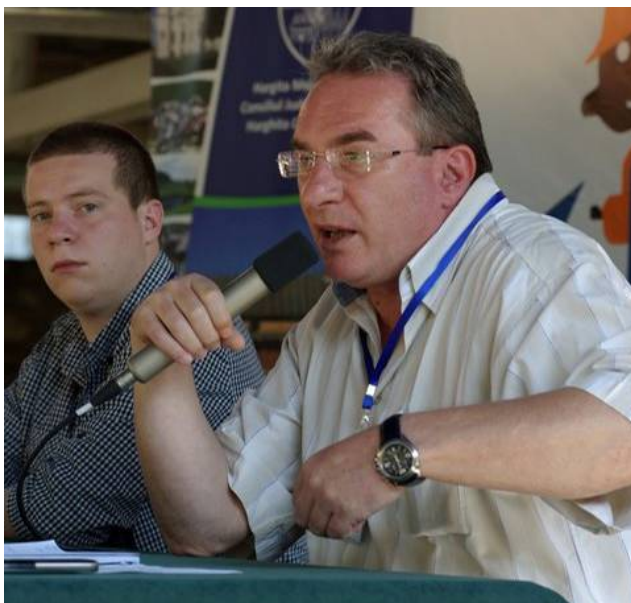
A MIÉRT 2011-es EU Táborában

A MIÉRT EU Táborában az EU2020 stratégiáról szóló előadáson a stratégia célkitűzéseit ismertettem. Elmondtam, hogy a stratégia három pillérrre épül. Az első pillér a tudásalapú társadalom, amely tulajdonképpen tudásalapú közösséget jelent. Az EU2020 stratégia kimondja, a gazdasági növekedés fő hajtómotorja az innováció kell hogy legyen. A második pillér a versenyképesség, ez nemcsak versenyképes gazdaságot, de versenyképes közösséget és versenyképes egyént is feltételez. A harmadik, az EP-képviselő szerint a legfontosabb pillér az emberközpontúság. A gazdasági fejlődést, az európai szociális modellt emberközpontúvá kell tenni, ugyanis sikeres egyének nélkül nincs sikeres közösség. Ezt a pillért azért is tartom a