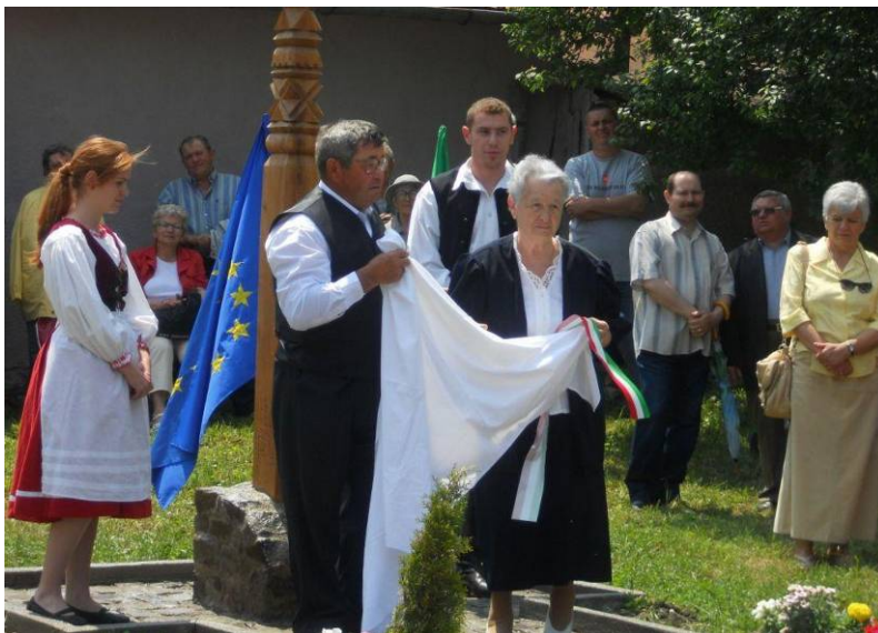
A bukovinai székelyek emlékére állított kopjafa Déván

Úgy vélem, nagyon fontos, hogy egy ilyen stratégiát folyamatosan töltsünk meg új tartalommal, a legújabb eleme pedig a szórványstratégiánknak a Székelyföld-Szórvány Partnerség, és ha ezt sikerül kiegészítenünk a magyarországi partnerekkel, úgymond háromszögesíteni, akkor munkánk nem volt hiábavaló. A dévai Téglás Gábor Iskolaközpontban megszervezett szórványkonferenciára hét erdélyi megyéből és Magyarországról érkeztek vendégek, Kovászna, Hargita, Hunyad, Temes, Beszterce, Fehér és Szeben megye, valamint Torda, Szombathely, Bács-Kiskun, Csongrád, Zala és Békés megye küldöttsége vesz részt a rendezvényen. A gyakorlati együttműködésre épülő program szervezői beszámoltak az eredményekről, egyeztettek a közös terveket, egyaránt bővítették a személyes és intézményes kapcsolatrendszerüket.