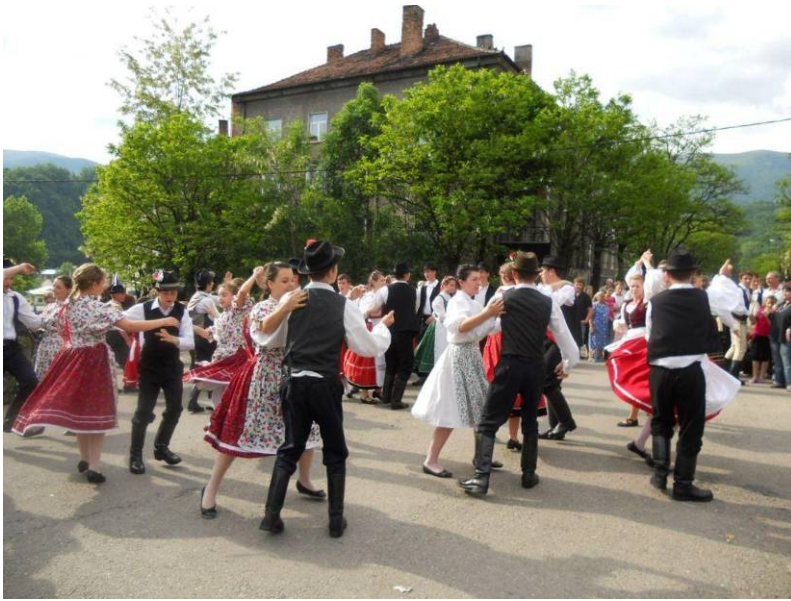
Lupényi magyar szabadtéri rendezvény