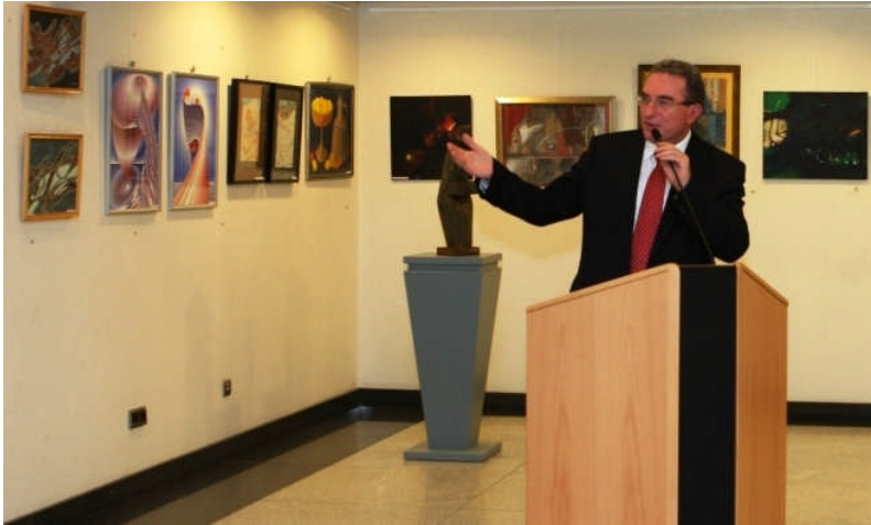
Képzőművészeti kiállítás az EP-ben 2010 októberében

kulturális ellenállás értékéről beszéltem, amely a szabadságvágy egyetlen kifejeződését jelentette a diktatúra évtizedeiben. A képzőművész egyesület Hunyad megyei szervezete egy olyan időszakban jött létre Romániában, amikor a kommunista rezsim konszolidációja, a nacional-kommunizmus megalapozása zajlott az országban. Ebben az időszakban Déva és Vajdahunyad csupán két szempontból volt értékes a kommunista hatalom számára: szén- és acéltermelése miatt. Nem volt könnyű művésznak lenni, a két város bányászati és kohászati központ volt, a művészeket, de általában az értelmiséget nem nézte jó szemmel a kommunista hatalom. A Hunyad megyei művészek abban az időszakban biztosan nem gondoltak arra, hogy a fennállás 55. évfordulóját Európa szívében, Brüsszelben fogják kiállítással ünnepelni.