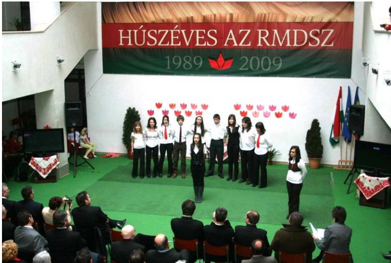
Az RMDSZ fennállásának huszadik évfordulóját ünnepeltük

építkező közösség tagjai, ahogy az RMDSZ is mindig építkező szervezet volt a Hunyad megyei szórványban.