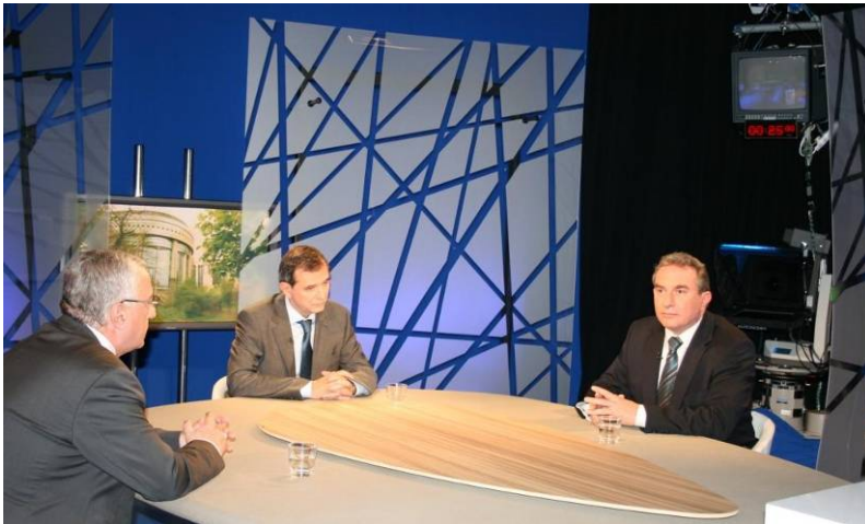
Az Európai Parlament TV-stúdiójában

A szénbányászat támogatásának folytatása már nem Brüsszel, hanem Bukarest és Petrozsény kezében van - mondtam el később egy romániai helyi televízióknak nyilatkozva. Hozzátettem, hogy szerintem a brüsszeli határozat jó időpontban született, hiszen sem a jövő évi állami költségvetést, sem a petrozsényi Kőszénbánya Vállalat 2011-es költségvetését nem fogadták még el, tehát jövőtől lehet alkalmazni az új lehetőségeket. Az elmúlt tizenkét évben egyetlen kormány sem tudott valós gazdasági alternatívát teremteni a Zsil-völgyi lakosoknak. Most határidőt kaptak, hogy mennyi idő alatt kell működő megoldásokat találni a térségbeli gazdaság problémáira. Személy szerint meggyőződésem, hogy a bányászat, újratechnologizált, modernizált változatban továbbra is nagy szerepet játszhat majd a Zsil-völgyében.