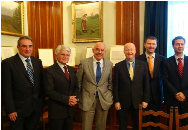
Az EP delegációja Martonyi János magyar külügyminiszterrel

Meggyőződésem, hogy szakpolitikai eszközökkel hatékonyan tudjuk támogatni az EU-n kívül élő magyar közösségeket. Horvátország mihamarabbi csatlakozását az EU-hoz következetesen támogatom, hiszen romániai magyar képviselőként különös figyelemmel követem a horvátországi magyar közösség sorsát. A témáról ebben a felvetésben egyeztetünk Budapesten Semjén Zsolt miniszterelnök-helyetttel és Martonyi János külügyminiszterrel az Nemzetközi Kereskedelmi Bizottság (INTA) 2010. novemberi látogatása kapcsán. A Nyugat-Balkán csatlakozása és a Duna stratégia által a kereskedelempolitika a horvátországi és vajdasági magyar közösségek számára a nemzetstratégia eszköze lehet. Ugyanezt a gondolatsort erősítette meg a Semjén Zsolt miniszterelnök-helyetttel folytatott megbeszélés, amelyen a vendéglátó kiemelte: a jelentős magyar közösségekkel rendelkező országok esetében a magyar nemzetpolitika érdeke az, hogy Közép- és Délkelet Európában sokoldalúbb és gazdagabb együttműködés alakuljon ki, ennek pedig a kereskedelem fontos eszköze.