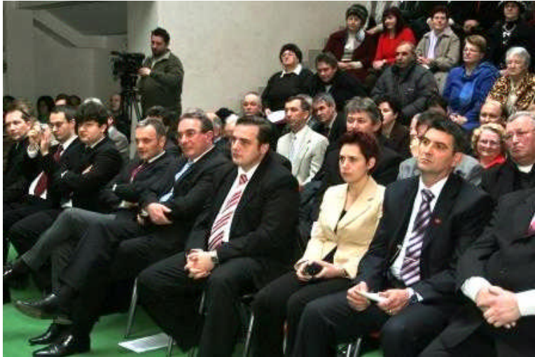
Együtt ünnepelünk a Téglás Gábor Iskolaközpont aulájában

Ugyancsak decemberben ünnepeltük a Hunyad Megyei Hírmondó megjelenésének tizedik évfordulóját. Az eseményen egykori és jelenlegi szerkesztők, tudósítók, munkatársak és a hűséges olvasók vettek részt. Az évek folyamán a lap munkatársai legtöbbször önkéntesen végezték ezt a nemes feladatot, amelynek köszönhetően minden hónapban megjelenhetett a Hunyad Megyei Hírmondó, jómagam lehetőségeimhez mérten mindig támogattam anyagilag a lap fenntartását, hiszen nagyon fontos közösségi szerepet tölt be. Hunyad megyében 2.600 magyar családhoz jut el rendszeresen magyar nyelvű újságunk, lefedve ezzel a megye összes magyarok is lakta települését.