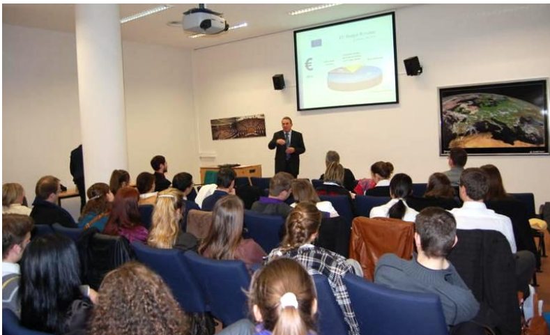
Előadás Brüsszelben a budapesti Corvinus Egyetem diákjainak

közös kereskedelempolitika alapelveit ismertettem, kitérve a kereskedelmi egyezmények típusaira is, majd konkrét példa kapcsán az EU-Dél-Korea szabadkereskedelmi megállapodást részleteztem. Néhány nappal később Brüsszelben a budapesti Corvinus Egyetem Államigazgatási Kar közigazgatás szakos hallgatóinak egy csoportjával találkoztam. A nekik tartott előadásban különlegesnek neveztem azt a szerepet, amelyben az erdélyi magyar képviselők találják magukat az Európai Parlamentben, hiszen a magyar nemzet tagjai, mandátumukat Romániában szerezték, a mandátumot pedig az erdélyi magyaroktól kapták. Természeteszerű, hogy politikai tevékenységünk legfontosabb részét a romániai magyarság érdekeinek képviselete, a kisebbségi jogérvényesítés eszközeinek megteremtése jelenti itt Brüsszelben is, kiegészítve azt a politikai tevékenységet, amelyet a Romániai Magyar Demokrata Szövetség a bukaresti parlamentben lát el.